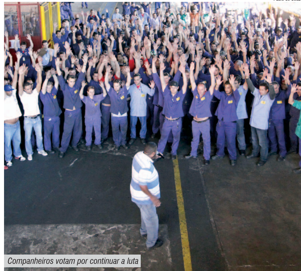
Companheiros votam por continuar a luta

A assembleia também decidiu que, em protesto, nas próximas 48 horas os trabalhos serão interrompidos por duas horas ao dia em cada um dos três turnos, incluindo a área administrativa.