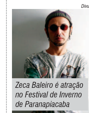
Zeca Baleiro é atração no Festival de Inverno de Paranapiacaba